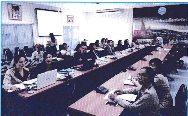
นำเสนอโครงการสหกรณ์ฯ สีขาว