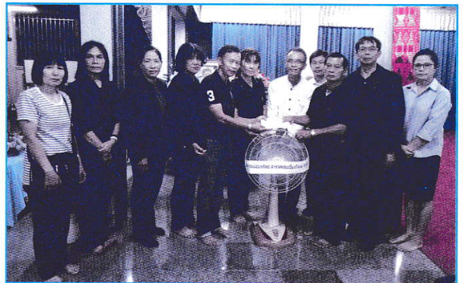
วางพวงพืชรัตนาตาสายตรงสมาชิกเสียชีวิต