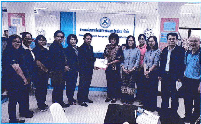
สหกรณ์สาธารณสุขลำปาง จำกัด เยี่ยมชมสหกรณ์สาธารณสุขเชียงใหม่ จำกัด