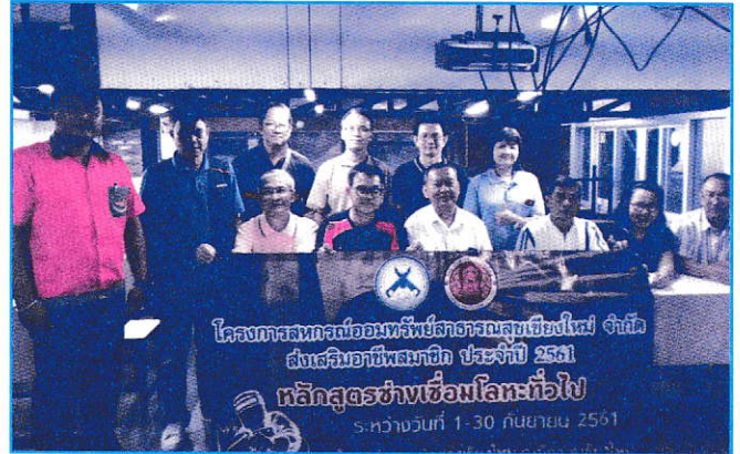
โครงการสร้างเสริมอาชีพสมาชิกประจำปี หลักสูตรช่างเชื่อมโลหะทั่วไป