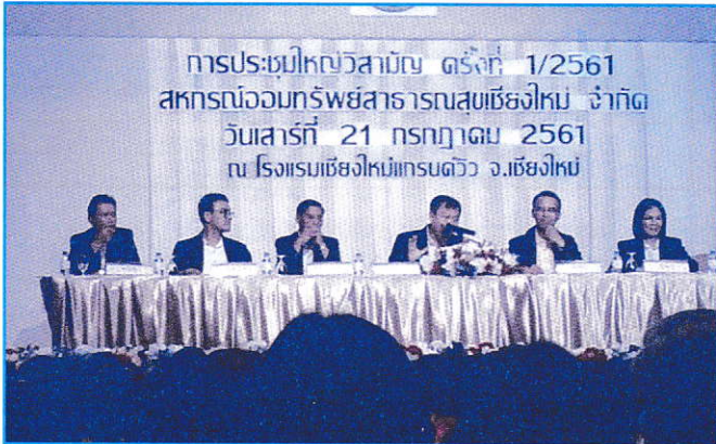
การประชุมใหญ่วิสามัญ ครั้งที่ 1/2561 เมื่อวันเสาร์ที่ 21 กรกฎาคม 2561