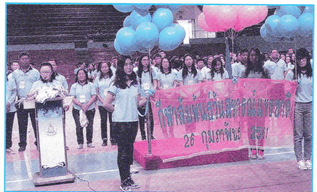
กีฬาสัมพันธ์วันสหกรณ์แห่งชาติ ที่สนามกีฬา 700 ปี เชียงใหม่ เมื่อวันที่ 26 กุมภาพันธ์ 2561