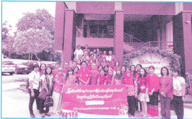
สหกรณ์ออมทรัพย์สาธารณสุขสตูล จำกัด มาศึกษาดูงาน ที่สหกรณ์ออมทรัพย์สาธารณสุขเชียงใหม่ จำกัด เมื่อวันที่ 12 มกราคม 2561