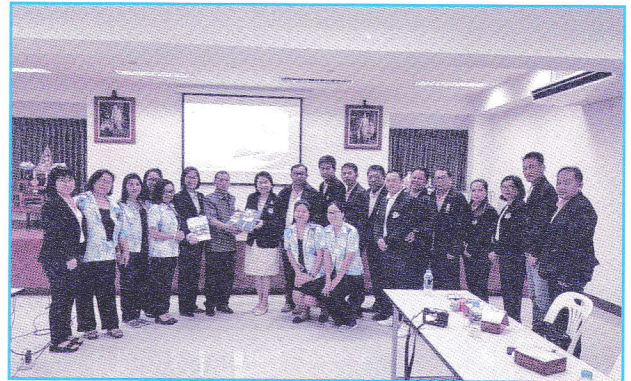
สหกรณ์ออมทรัพย์สาธารณสุขจันทบุรี จำกัด มาศึกษาดูงาน ที่สหกรณ์ออมทรัพย์สาธารณสุขเชียงใหม่ จำกัด เมื่อวันที่ 5 มีนาคม 2561