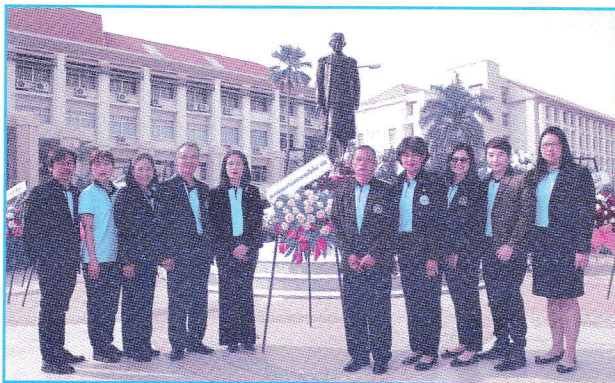
บุคลากรสหกรณ์ออมทรัพย์สาธารณสุขเชียงใหม่ จำกัด ร่วมงานวันสหกรณ์แห่งชาติที่มหาวิทยาลัยแม่โจ้ เมื่อวันที่ 26 กุมภาพันธ์ 2561