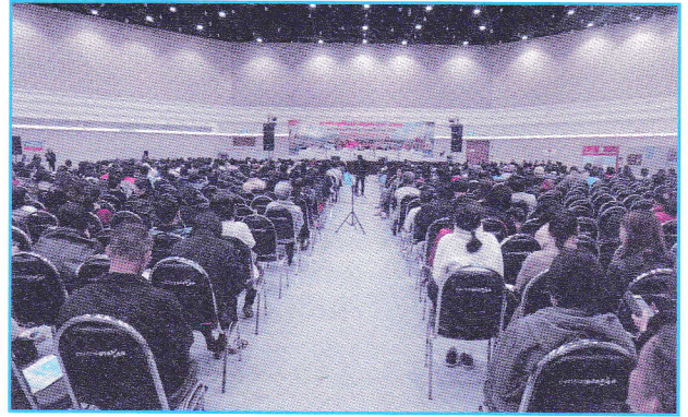
การประชุมใหญ่นโยบายประจำปี 2560 สหกรณ์ออมทรัพย์สาธารณสุขเชียงใหม่ จำกัด เมื่อวันที่ 23 ธันวาคม 2560 ณ เชียงใหม่ฮอลล์ ศูนย์การค้าเซ็นทรัลพลาซ่า เชียงใหม่แอร์พอร์ต